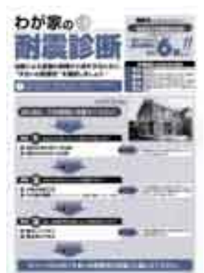
▲わが家の耐震診断

既に申し込みの済んでいる方は、再度、申し込み必要はありません。後日、市から耐震診断の案内がきを送付します。診断日時などを打ち合わせした後、耐震診断員を派遣します。