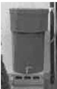
▲雨水利用の簡易貯留槽