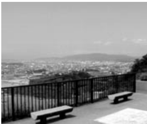
▲蒲郡調整池からの眺望