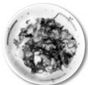
84キロカロリー(1人分)