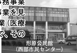
形原公民館 (西部市民センター)

市では、行政改革を進めるために、平成15年度から事務事業評価を本格導入し、市役所で行っているすべての事務事業を見直しています。今年度は、平成18年度に実施した710事業（医療関係を除く）のうち245事業について評価をしましたので、その結果をお知らせします。