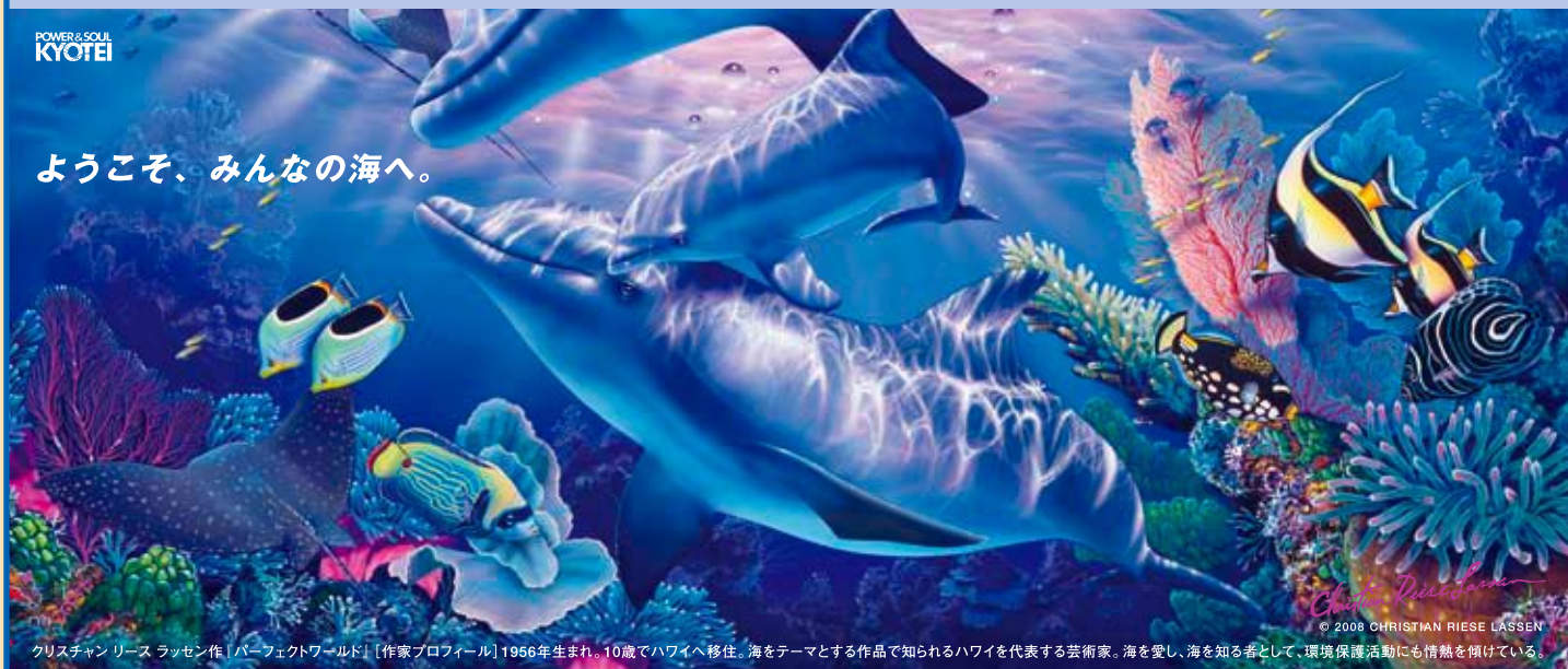
クリスチャン・ラッセン作「パーフェクトワールド」[作家プロフィール]1956年生まれ。10歳でハワイへ移住。海をテーマとする作品で知られるハワイを代表する芸術家。海を愛し、海を知る者として、環境保護活動にも情熱を傾けている。

蒲郡競艇では「海を守り、海を愛する」ことを合言葉に、海洋マリンアートの巨匠クリスチャン・ラッセンの作品を、SGオーシャンカップイメージビジュアルとして展開しています。