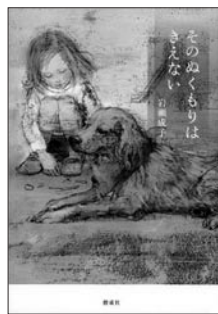
「そのぬくもりはきえない」岩瀬成子／著 偕成社

犬の散歩を引き受けて出入りするようになった家で出会った不思議な男の子。なんだかちくはぐなのに、どうしようもなく響きあう心と心…。子どもたちの現在を描き続けてきた児童文学作家による長編。