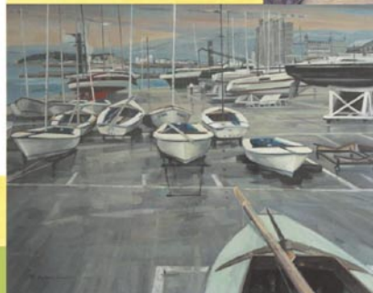
「蒲郡ヨットハーバー」 ／鈴木睦美