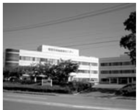
保健医療センター