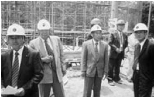
西浦配水池築造地を視察する経済委員