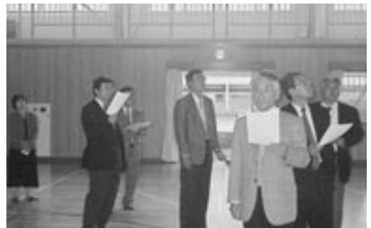
中部中学校体育館の耐震補強の説明を受ける文教委員

文教委員会は、25日に開き、市民病院での説明の後、学校給食センター、グールプホームあざれあ、中部中学校体育館の耐震補強、蒲郡市障がい者支援センターを視察しました。