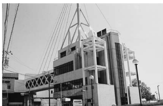
競艇場ポータルタワー