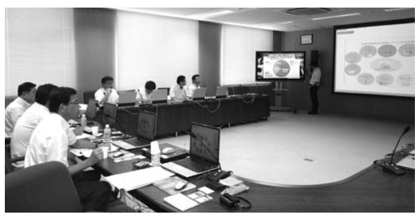
総務委員会が行った地域WIMAXの視察