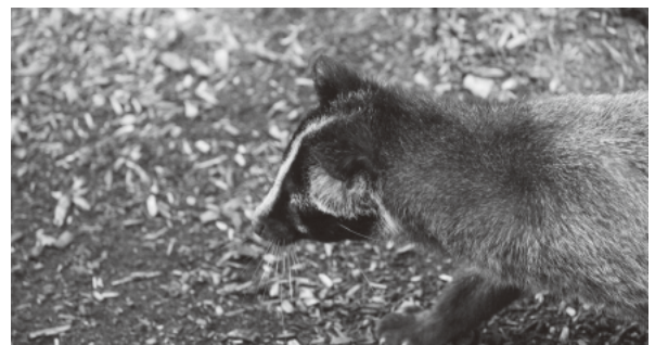
被害が報告されているハクビシン