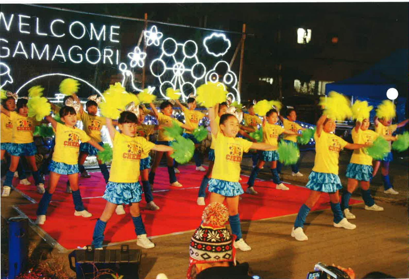
寒さに負けず元気にダンス