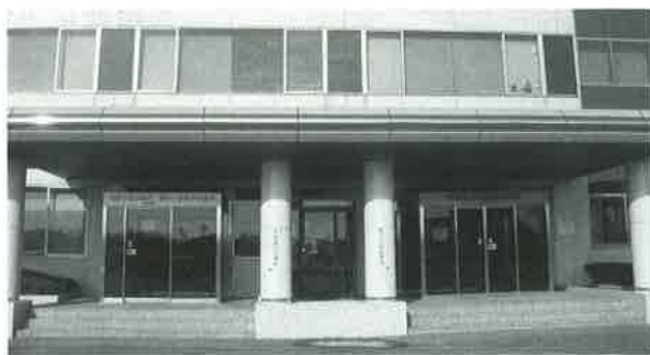
休日急病診療所等が設置されている保健医療センター

消費税法等の改正に伴い、平成26年4月1日から蒲郡市の使用料等にかかる消費税率(地方消費税分を含む)を100分の5から100分の8に引き上げます。対象となる使用料等は次のとおりです。 使用料関係は、使用期間が1か月未満の公共用物や