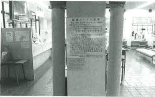
綱引きの公式大会でも利用されている蒲郡産のロープ

問 中学校区対抗で行えば、市民総ぐるみの参加になって、蒲郡まつりが盛りあがると思うが、市制60周年の節目に60人対60人で蒲郡産のロープを使って綱引き大会を開催してはどうか。