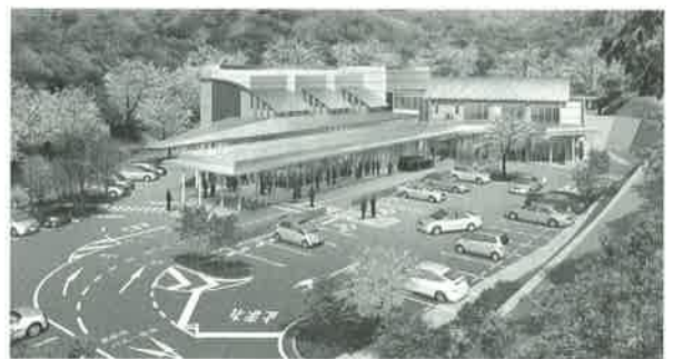
新斎場の完成予想図(イメージ)

平成25年12月10日に開かれた経済委員会において、9月30日で終了した新斎場の実施設計業務で基本設計