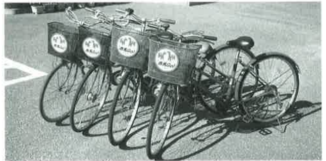
西尾市でレンタサイクルが行われている赤馬Go!

問 名鉄沿線や駅前で放置自転車を利用したレンタサイクルの貸し出し場所があれば、観光地巡りに便利で名鉄電車の利用促進も図られると思うがどうか。