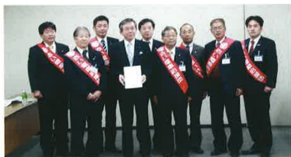
両市議会で名古屋鉄道株式会社に要望書を提出

訪問し、存続要望書を提出しました。また平成26年1月6日には平成25年12月議会で可決した「名鉄西尾・蒲郡線」の存続に向けた支