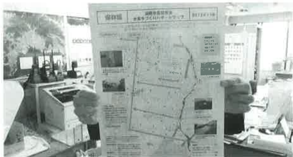
地域住民の手で作られた防災マップ

問 地域住民による防災マップづくりは防災意識の啓発にもなり、重要な防災対策と考えるがどうか。