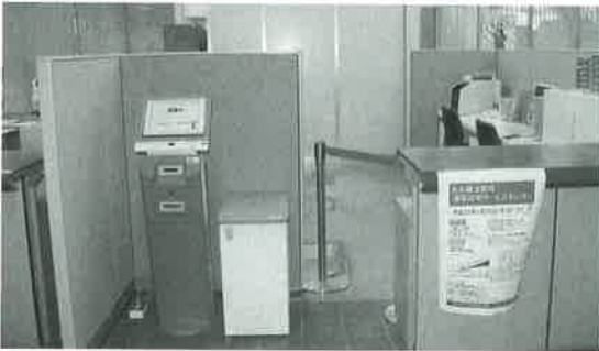
蒲郡市役所内に設置される法務局窓口

に向けての作業日程は。平成26年1月20日の開設に向けて、25年中に会計室と保険年金課の間に間仕切りを設けて電話等の回線工事を行い、年明け早々に証明書発行請求機等を搬入する予定である。