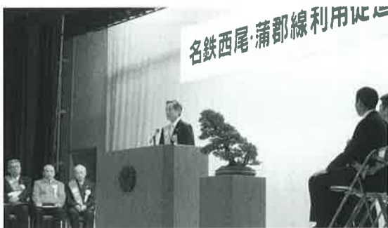
平成25年12月開催の名鉄西尾・蒲郡線利用促進大会

答 県は補助金の継続支出は困難との考えを示している。蒲郡市と西尾市では、存続の取り組みを続けており、承知できないという意向を県に伝えた。12月議会後に再度、県知事に要望していく予定である。