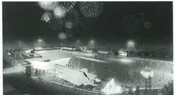
リニューアルオープンするボートレース蒲郡 (イメージ)

のデートスポット化やステージのコンサート利用等、ボートレースファン以外の集客にも取り組んでいく。