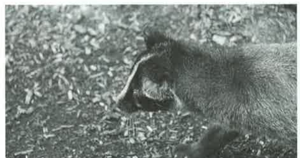
被害が報告されているハクビシン

答 今年度制定した空き家等適正管理条例により、空き家が野犬、野良猫等のすみかとならないよう未然に防止するため、担当部署と連携を密にして、必要な