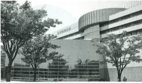
ヘルスケア計画との連携が期待される市民病院

答 先端医療分野の企業に市民病院が協力できれば、医師にとつて研究環境が整った魅力的な病院となる。その上で、実績が蓄積されれば、地域医療拠点と臨床研究拠点の機能を持つ中核医療機関として発展する可能性がある。今後も先進的な病院のあり方と経営改革の研究をしていきたい。