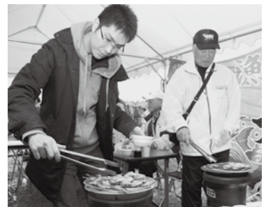
西浦駅周辺でにしろ市場の開催