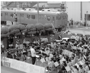
市ジュニア吹奏楽団、沿線吹奏楽部による名鉄駅前コンサート

平成21年9月に市民の総力で赤い電車を存続させるため結成。市総代連合会をはじめ市老人クラブ、市P連など22団体で組織。赤い電車を残すためのPR活動、利用促進活動を実施。西尾市応援団とも連携を図っています。