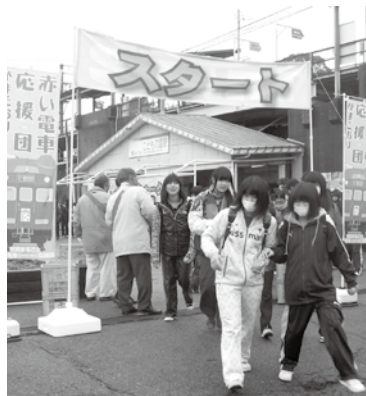
西尾市高校生の沿線ウォーキング