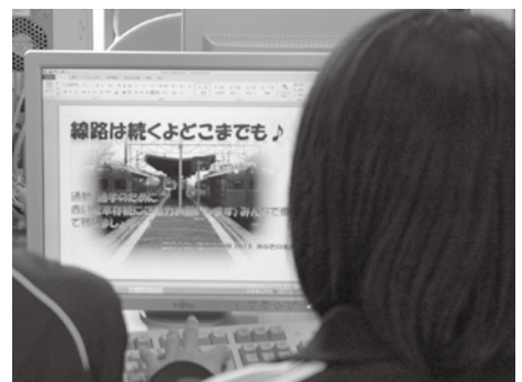
中学生による応援ムービーの作成

市としては、平成28年度以降の運行について学生の皆さんなどの通学利用を考慮し、今年度中に名鉄存続の方向性を決定したいと考えています。それには、市民の皆さんが名鉄を利用し、利用者を増加させることが重要になります。市民の皆さんの利用で名鉄西尾・蒲郡線を存続させましょう!