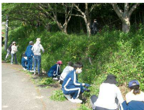
5月11日(日)今年最初の地域ふれあい活動は、塩津中学校区の西迫地区でした。桜の馬場と、通学路の草刈りを実施しました。

※資料引用：河合塾「わくわく☆キャッチ!キミのミライ発見活用ガイド」 ネット依存相談窓口から http://www.wakuwaku-catch.net/