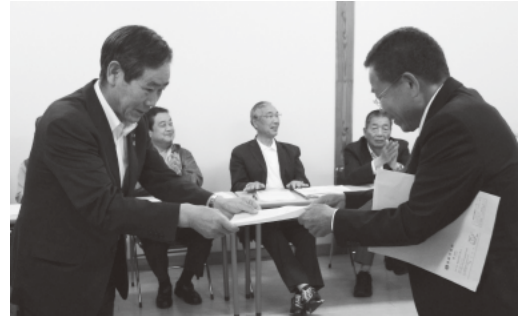
5月20日 形原地区公共交通協議会からの要望書の提出