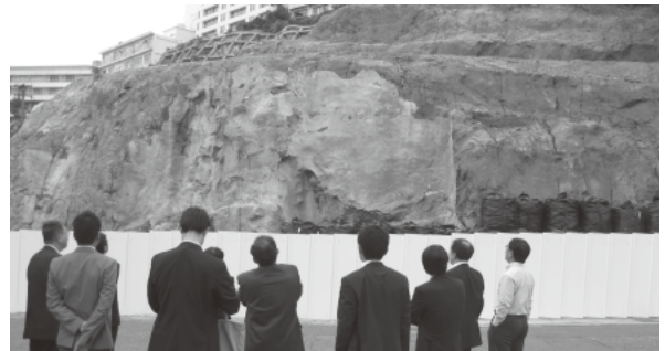
南風荘跡地を視察する総務委員