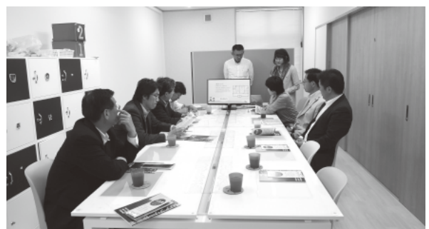
キッズサポートセンター千兵衛で説明を受ける文教委員