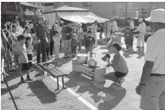
港区防災訓練では、実際に「かまどベンチ」を使って炊き出しを行いました。

子どもたちのための防災・減災対策は、大変重要であると考えています。建物の耐震化工事については、すべての保育園ならびに小中学校で完了しています。保育園や幼稚園へ出向き、防災教室