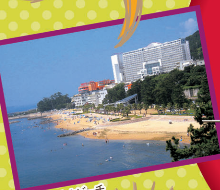
吉良ワイキビーチ