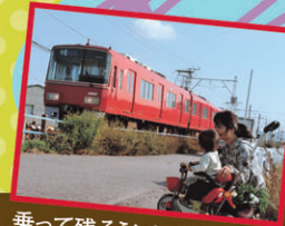
乗って残そうにしがま線!