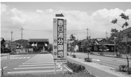
～人と自然が調和する街～春日浦住宅地

答 海沿いの土地の販売は厳しいという意見があり、販売目標を立てることは非常に難しい。今後は、不動産業者からの意見を生かし、春日浦住宅のよいところをアピールし、地域の