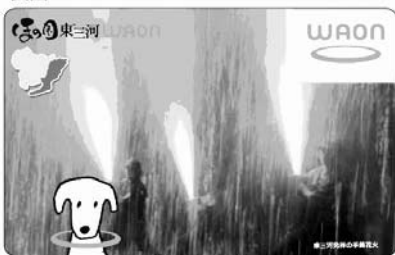
東三河発祥の手筒花火