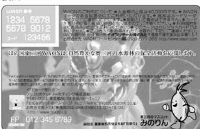
国指定 重要無形民俗文化財「花祭り」