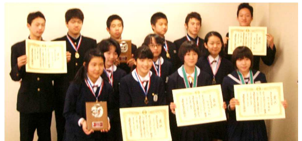
蒲郡教育奨励賞の受賞者のみなさん