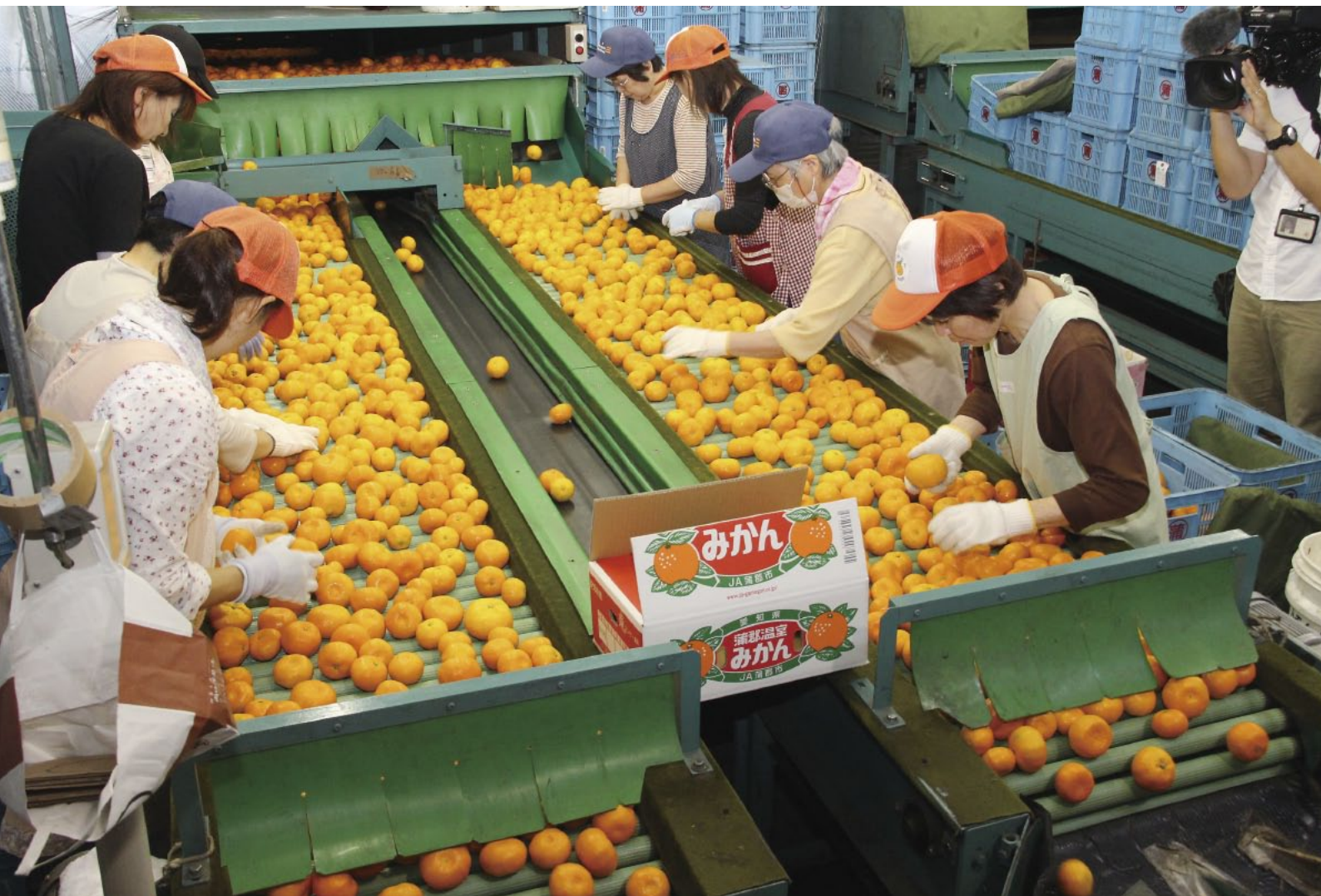
温室みかんの出荷が最盛期!!