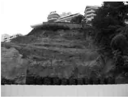
旧「南風荘」跡地の様子