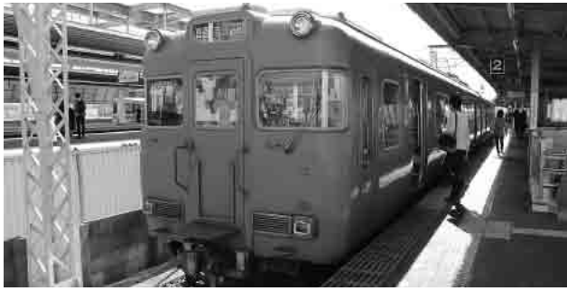
名鉄西尾・蒲郡線