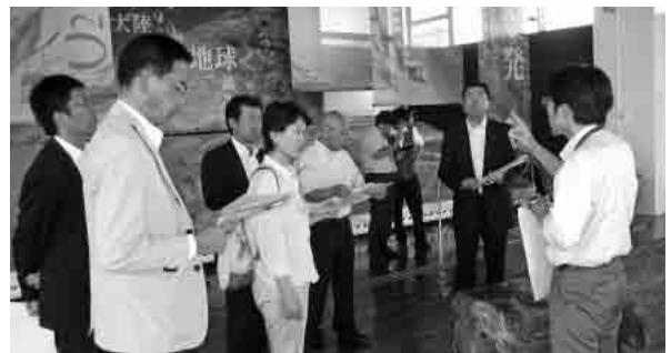
生命の海科学館で説明を受ける文教委員

び院内の見学後、学校給食センター、特別養護老人ホームさくらの木、生命の海科学館を視察しました。