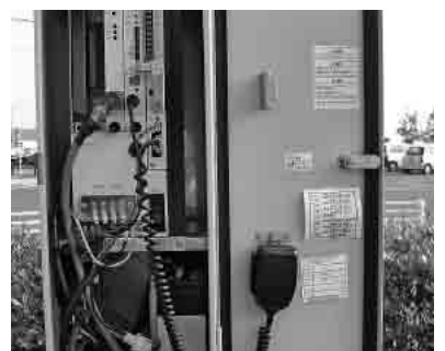
防災行政無線子局

答 屋外拡声器としての個別使用は、要綱に基づき総代が申請し、市が使用の許可をする。地元の判断で活用が可能となっている。