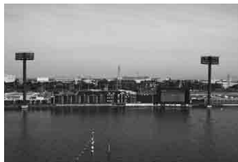
現在の対岸大型映像装置等

対岸大型映像装置等更新工事は、6月11日に3社による指名競争入札を行い、三菱電機株式会社中部支社が5億201万6400円で落札し、契約を締結しました。また、対岸大型映像装置土台築造工事について