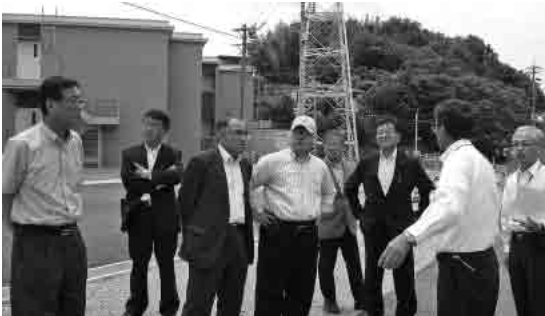
国道247号中央バイパスを視察する経済委員