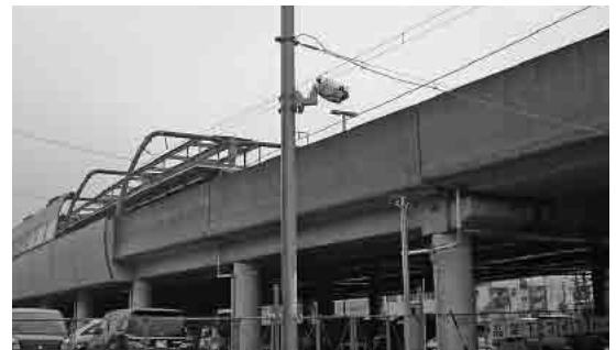
蒲郡駅東駐輪場の防犯カメラ

答 犯罪の防止、防犯力の向上に効果のあるものだと認識しており、早ければ今秋から、防犯カメラ設置に関する補助制度に取り組んでいきたい。