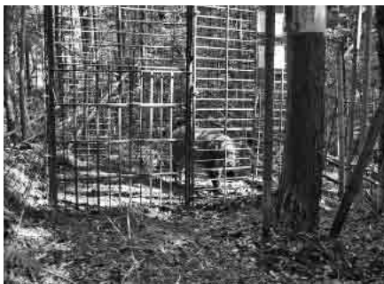
捕獲されたイノシシ