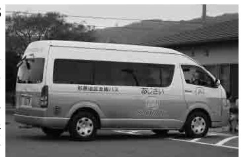
あじさいくるりんバス

18・7人の利用。形原の高齢者の利用がほとんどだった。ルート変更や市民病院までの運行を求めるような意見があった。