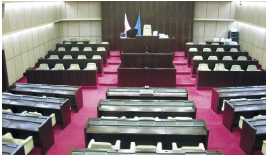
傍聴席から見た本会議場

また、本会議日程と一般質問の内容は、市役所1階ロビーや市議会ホームページでもお知らせします。