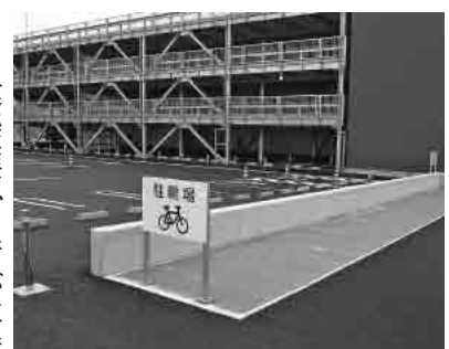
ポートルース蒲郡の駐輪場