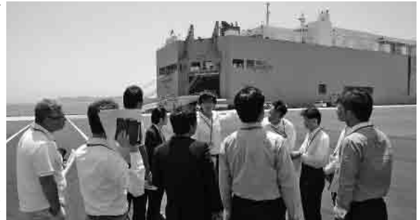
11m岸壁の説明を受ける総務委員

び院内の見学後、学校給食センター、特別養護老人ホームさくらの木、生命の海科学館を視察しました。