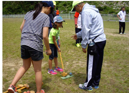
五月十五日に行われた蒲郡西総代区の地域ふれあい活動の様子です。

5月10日(火)の中部中学区をスタートに、各中学校区で開催された健全育成協議会も、5月29日(日)の三谷中学区を最後にすべてが終了しました。それぞれの会場で青少年に関わる情報交換が活発になされ、「地域の子どもたちは、地域みんなで見守り育てる」と機運が一層高まったように感じました。ご尽力いただきました関係者の皆様ありがとうございました。