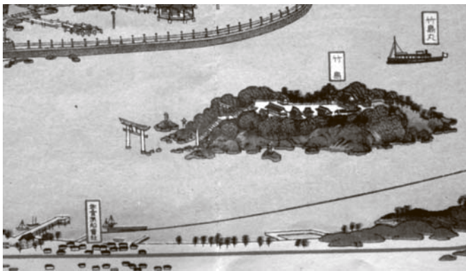
「東海名所蒲郡 常磐館案内」鳥瞰図(部分) 右上に「竹島丸」、左下に「参宮汽船会社」 コンクリート製の竹島橋は昭和7年架橋なのでまだない

ンフレットの鳥瞰図には「参宮汽船会社」の文字と航路、竹島付近を航行する「竹島丸」という観光船が描かれています。 昭和30年代後半には「水中翼船」が名古屋・鳥羽と蒲郡を結びました。前方底部にスキー板のような翼がついた船は水の抵抗が小さく、高速航行が可能でした。昭和40年代には、空気で船体を浮上させて進む「ホバークラフト」が登場。乗船時の独特な浮遊感ほか、他の船舶とは一線を画するものでした。残念ながらどちらも短命で昭和50年代には姿を消し、次世代の高速船へ主役の座を譲りました。