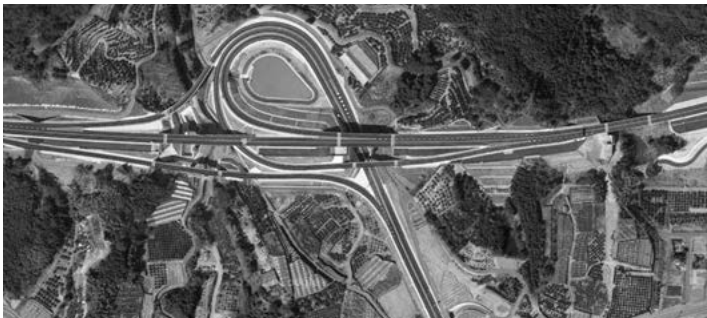
開発中の柏原地区企業用地周辺

問 新たな企業用地候補地の選定はいつになるか。柏原地区の造成工事がひとつの目安となる。