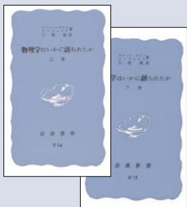
『物理学はいかに創られたか』上 アインシュタイン 他／著

そうだね。ただし、相当古いのので、すでに創 造された物理を学ぶの ではなく、その経緯を 学ぶという読み方が大 切かな。全体を見ると いうことについては、 物理学に限らず、自然 科学の入門書としても 非常に素晴らしいと思 います。