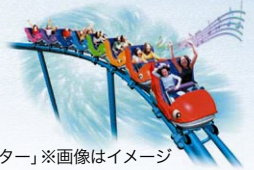
「ステラ コースター」※画像はイメージ