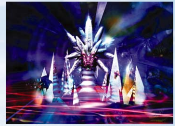
「ファイア ファイア NEXT~レビヤタンの逆襲」