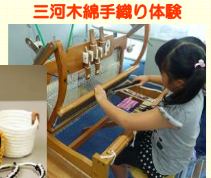
三河木綿手織り体験