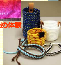
ロープで小物作り