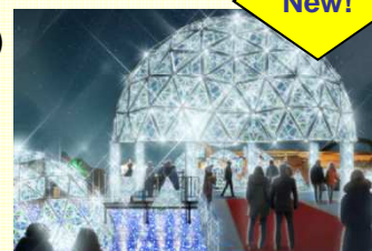
光のプロムナード