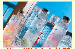
ハーバリウム体験

★「みかわdeオンパク」の参加申し込みは公式HPから http://taikenplan.jp/