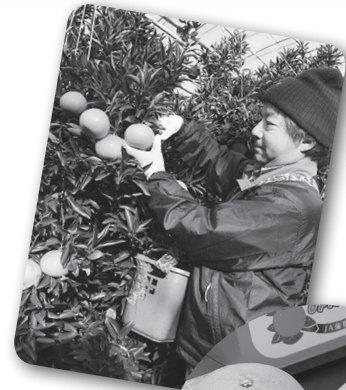
せとか 清見とアンコールを 交配し、マーコット を掛け合わせた品種。

皮をむくと、周りには爽やかな香りが広がります。味はとても甘く口に入れるとあっという間にとろけることから、みかんの大口とも呼ばれます。