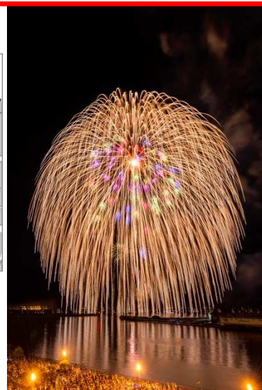
【特別観覧エリアからの眺め】