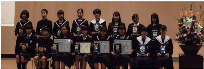
昨年度の出演者のみなさん

今年の地域安全・健全育成市民大会は、10月23日(水)に市民会館中ホールで行われます。子どもたちの意見発表は、家族のこと、友達のこと、偶然の出会いなど普段の生活の中で感じたことを素直に語ってくれます。毎年参加者から「子どもたちの意見に感動した」などの感想が寄せられています。本年度も校内で選抜された小学生2名(蒲西小、塩津小)と中学生7名、高校生3名が発表します。