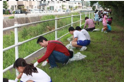
9月1日(日) 中央小学区ふれあい活動