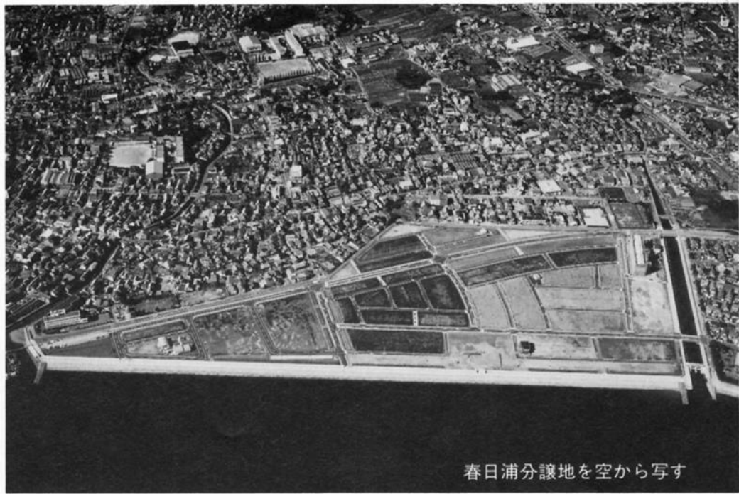
春日浦分譲地を空から写す

人口増加と公共事業促進などの切り札として昨年6月形原町に完成した「春日浦住宅地」。これまで、宅地のみの分譲を、3回に分けてご案内し、多数の応募をいただきました。 この分譲とは別に、市内の建設業協同組合により建設を進めてきた「建物付宅地分譲区画」が間もなく完成となります。今号では、この分譲内容等についてお知らせします。