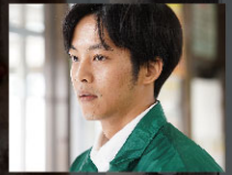
松坂桃李 青柳直人 役 1988年生まれ。神奈川県出身。