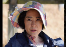
寺島しのぶ 草加部麻子 役 1972年生まれ。京都府出身。