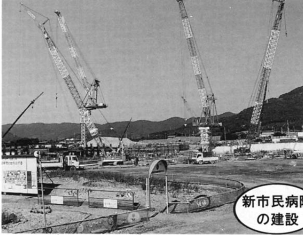
新市民病院 の建設

平成7年3月から着工し、順調に工事が進み、現在、病棟部分（高層棟）の1、2階鉄骨工事がほぼ完了しました。外来部分（低層棟）については、掘削工事が終わり基礎工事に取りかかっています。