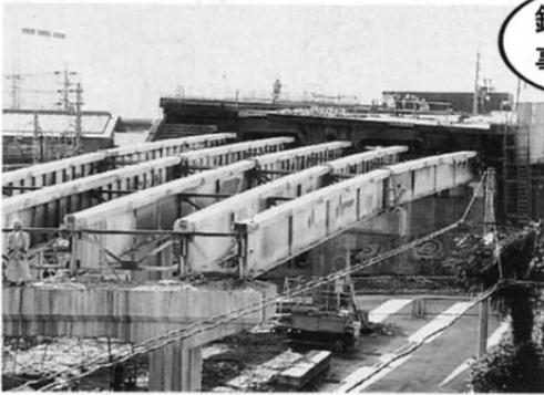
鉄道高架 事業促進

平成7年3月から着工し、順調に工事が進み、現在、病棟部分（高層棟）の1、2階鉄骨工事がほぼ完了しました。外来部分（低層棟）については、掘削工事が終わり基礎工事に取りかかっています。