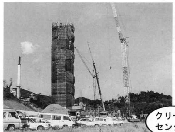
クリーン センター

今年も残すところ、あとわずか。市内各地で進行中の建設現場から、工事の写真をお届けします。公共事業の進展には、関係する地主や権利者の人たちの多大なご協力があることを忘れないください。