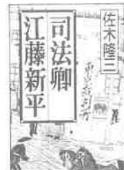
「司法卿 江藤新平」 著 佐木隆三 発行 文藝春秋

明治七（一八七四）年、「佐賀の乱」の首謀者として佐賀裁判所で死刑の判決を受け、その日のうちに斬首され、三日間の晒し首に処せられた初代法務大臣・江藤新平。なぜ彼は栄光の座を捨てて下野したのか。この判決は「力の強弱で決まったもので、公平な裁判とはいえない」という著者が、その真相に迫る歴史長編である。