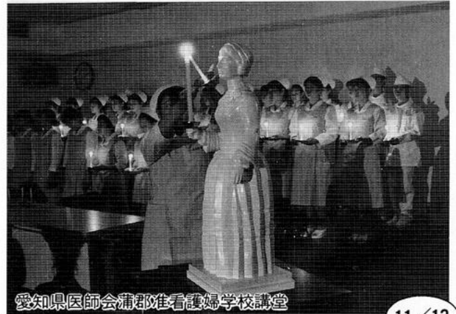
愛知県医師会蒲郡准看護婦学校講堂