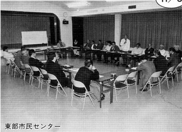
東部市民センター