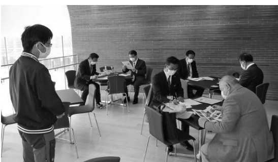
ボートレースとこなめでの視察の様子

先進自治体の事例を学ぶため、11月17日に次のとおり行政視察を行いました。 ・常滑市／ボートレースとこなめ