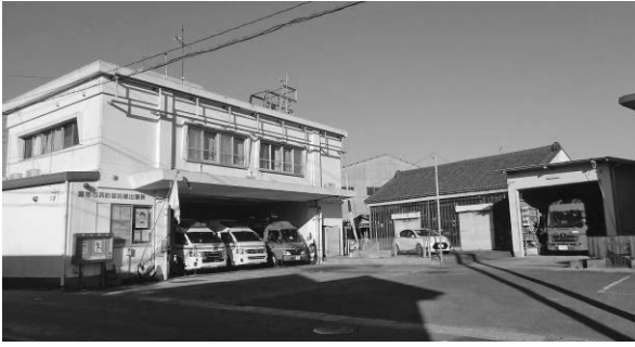
現在の消防署西部出張所

12月8日に開かれた総務委員会において、消防署西部出張所の移転建設事業について、移転建設用地の取得が完了したことと、建設概要及び今後の建設スケジュールが報告されました。