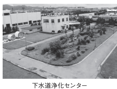
下水道浄化センター

答 今後も施設を適正に運転し、安定した放流水の水質確保のため、設備の改築、更新を行っていく予定である。現時点で国や県との協議、調整が行われておらず、経費削減効果も不明だが、将来にわたる持続的な経営を確保する観点から広域化・共同化の可能性を検討する中で、豊川浄化センターへの下水道施設の統合について、その可能性を排除するものではないと考えている。