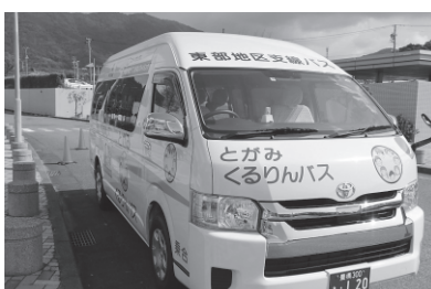
コミュニティバス

答 今後は、これまでの方法にこだわらず、市全体の交通ネットワークについて考え、行政が主導しながら、地域住民と一緒に地域に適した公共交通の導入方法を検討する。