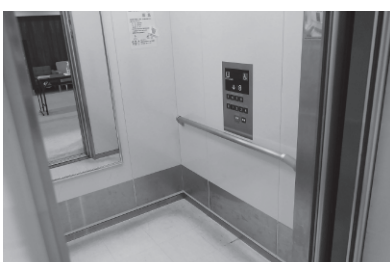
市役所エレベーターの手すり

問 エレベーターの防 災グッズ入りイスの設 置状況と取組の考えは。 答 現在、設置はなく、 施設用途等を考慮し設 置施設の検討をしてい きたい。