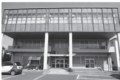
解体前の西部防災センター