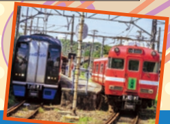
乗って残そうにしがま線!