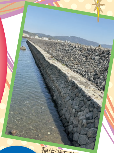
稲生港石積防波堤