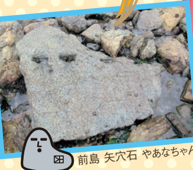
前島 矢穴石 やあなちゃん

15:00ゴール受付終了(名鉄東幡豆駅前) ゴール後アンケートにご協力ください。又、新型コロナウイルス感染 拡大防止のため、住所・氏名・連絡先の記入にもご協力ください。