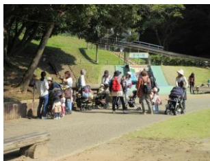
<赤塚山公園へバス遠足>