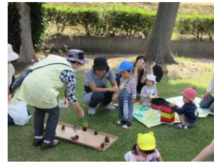
<公園への散歩 まつぼっくり釣り>

3 対象：市内在住の1～3歳児(5月17日時点満1歳以上)のお子さんとその保護者