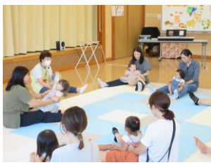
<親子でふれあひあそび>