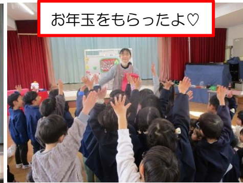
お年玉をもらったよ♡