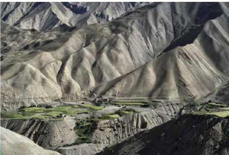
第 14 回惑星地球フォトコンテスト 優秀賞「Lingshed Village」佐藤竜治さん