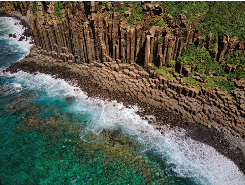
第 14 回惑星地球フォトコンテスト 最優秀賞「古代の双六」朝永武志さん