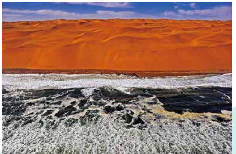
第 14 回惑星地球フォトコンテスト 優秀賞「大西洋と砂漠」近藤洋さん