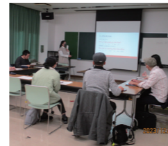
▲先生の熱心な講義に耳を傾ける参加者

活発な質問が飛び交い有意義な教室でした。先生からの提供でベトナムのコーヒーと緑豆で作られたお菓子を味わいました。