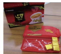
▲ベトナムのコーヒーとお菓子