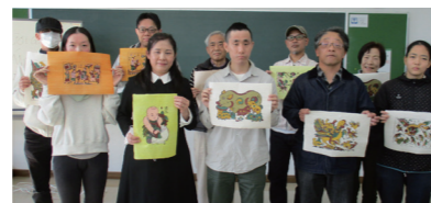
▲ベトナムの伝統的な版画を持つ参加者

活発な質問が飛び交い有意義な教室でした。先生からの提供でベトナムのコーヒーと緑豆で作られたお菓子を味わいました。