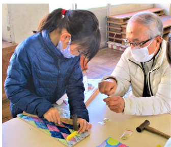
【釘打ち支援】(竹島小)