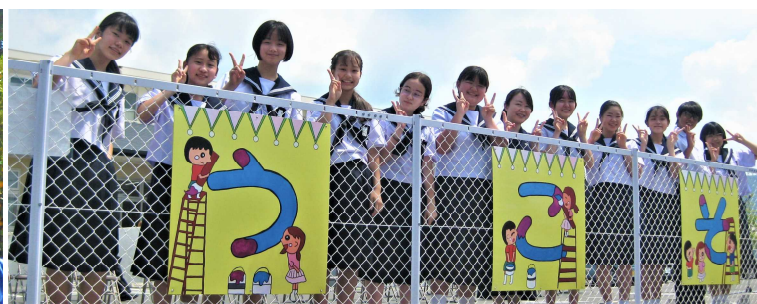
【府相公民館看板制作】(蒲郡中)