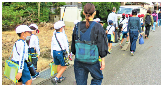
【町探検引率】(蒲東小)