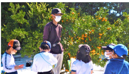
【みかん農家取材】(蒲東小)