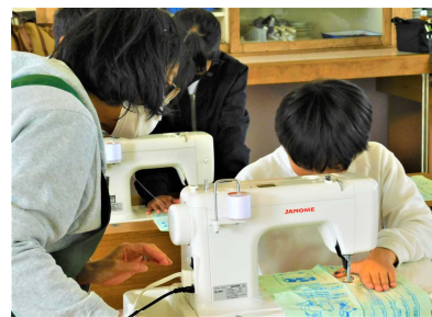
【ミシン操作支援】(蒲南小)