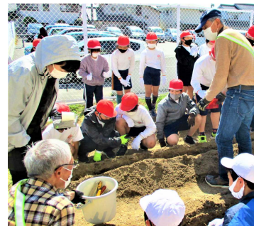
【ジャガイモ植付】(竹島小)