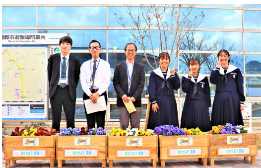
【ともに咲かそう笑顔の花】(蒲郡中)