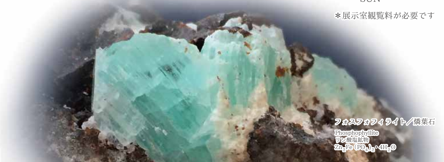
フオスフォファイライト/燐葉石