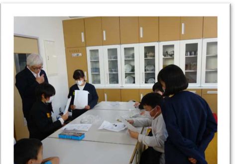
1/29イングリッシュキャンプ

令和4年度から小学校の部活動がなくなります。その受け皿として昨年度試行的に放課後子ども教室「イングリッシュキャンプ」を開催しました。希望者20名程度の子どもたちが集まり、5名のボランティアの方に英語を教えてもらいました。授業後30分程度の活動でしたが、子どもたちは意欲的に活動できました。今年度も、実施していきたいと思います。