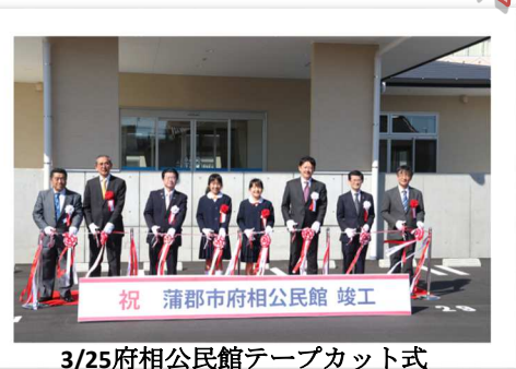
3/25府相公民館テープカット式

さて、府相公民館との連携・協働活動ですが、新型コロナウイルス感染症の影響で足踏み状態です。でも、毎週1回、関係者が集まって、どんなことができるか話し合っています。とりあえずは子どもたちの生活が落ち着いたころ、できることから少しずつ始めていきたいと考えます。