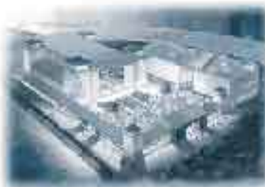
あいち・おまつり広場

市の催しの日が8月26日(金)・27日(土)の2日間に決定しました。現在、この2日間で蒲郡市の魅力が存分に発揮できるような催しを検討しています。市民の皆さんのご協力をいただき、地元の産業や伝統文化、名産品を世界に向けて発信する良い機会にしたいと考えています。