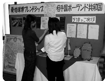
ポーランド館のロゴマーク