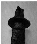
つばはばき (鐔・鍔)