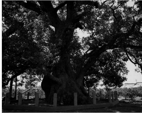
国指定天然記念物「清田の大クス」